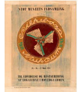
Asger Jorns indsamlingsplakat i 1953 til fordel for det kommende Silkeborg Museum .