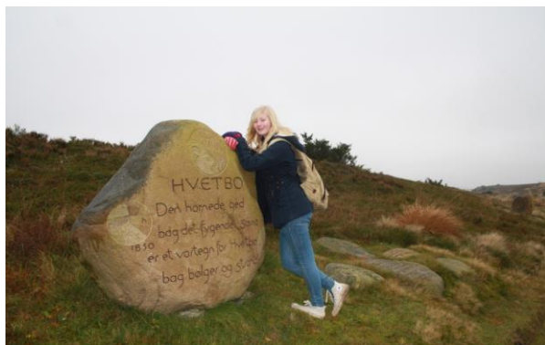
Elev på Kongenshus Hede - sansetur

Mødet med Blicher havde mange indfaldsvink-