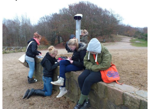
Elever på Himmelbjerget - skriveopgave

Det er centralt at holde sig for øje, hvilken opfattelse elever har af at komme på et kulturhistorisk museum og især hvilket forhold, de kan have til Blicher. Det er for det meste et ikke eksisterende og ikke interesseret forhold – ” de er jo der, fordi deres lærer siger, de skal være der ”. Dvs. udgangspunktet kan være modstand. Det er det, vi skal forsøge at vende på de timer, eleverne er her på museet. Det er hele essensen af projektet. Omvendelsen sker i høj grad ved nærvær, ved at man som formidler er interesseret og imødekommende. Desuden sker det også i arbejdet med de skræddersyede opgaver, hvilket vi i høj grad har set i dette projekt. Eleverne har skullet gå til arbejdet med Blicher på en anden måde, og det har de selv kommenteret har været spændende.